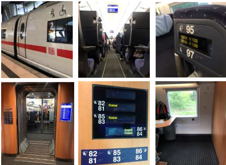
【 그림 28 】 Frankfurt Airport행 ICE열차 안내 설비