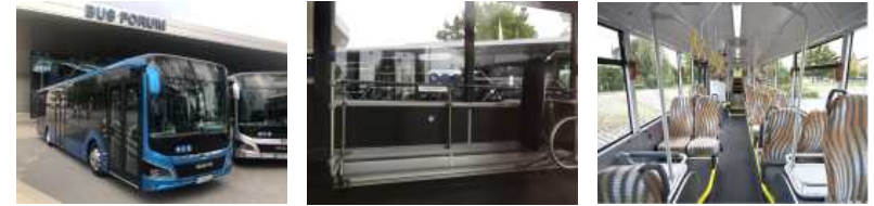
【 그림 23 】 MAN Lion's CITY U