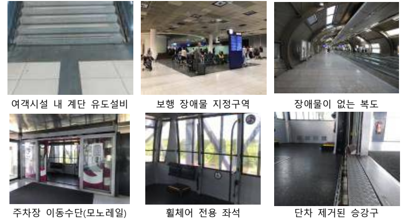
여객시설 내 계단 유도설비