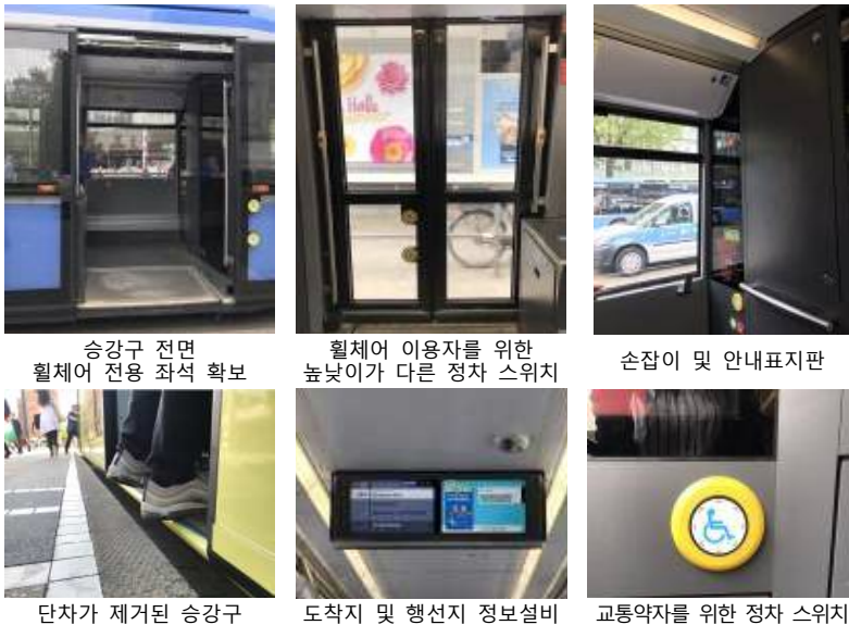
승강구 전면 휠체어 전용 좌석 확보 휠체어 이용자를 위한 높낮이가 다른 정차 스위치 손잡이 및 안내표지판