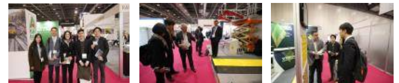
【 그림 4 】 International Railway Infrastructure