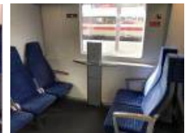
【 그림 20 】 Munich Main Hbf 철도 차내 설비