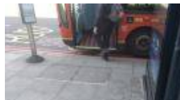
버스 표지판 연계된 버스 정차