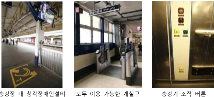
승강장 내 청각장애인설비 모두 이용 가능한 개찰구 승강기 조작 버튼