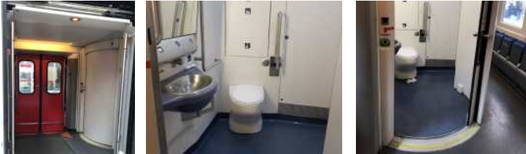
【 그림 21 】 Munich Main Hbf 철도 승강구