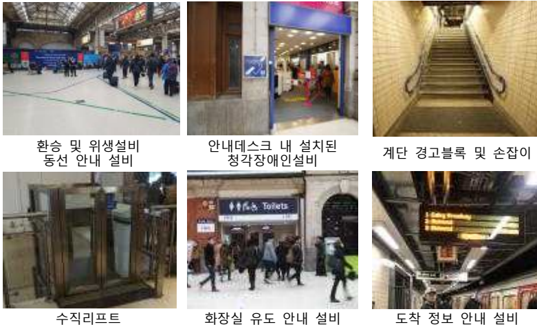
환승 및 위생설비 동선 안내 설비 안내데스크 내 설치된 청각장애인설비 계단 경고블록 및 손잡이 수직리프트 화장실 유도 안내 설비 도착 정보 안내 설비