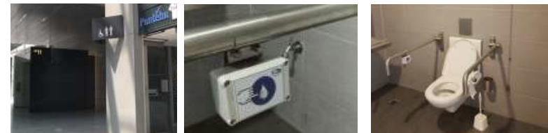
이용 가능한 화장실 안내표시