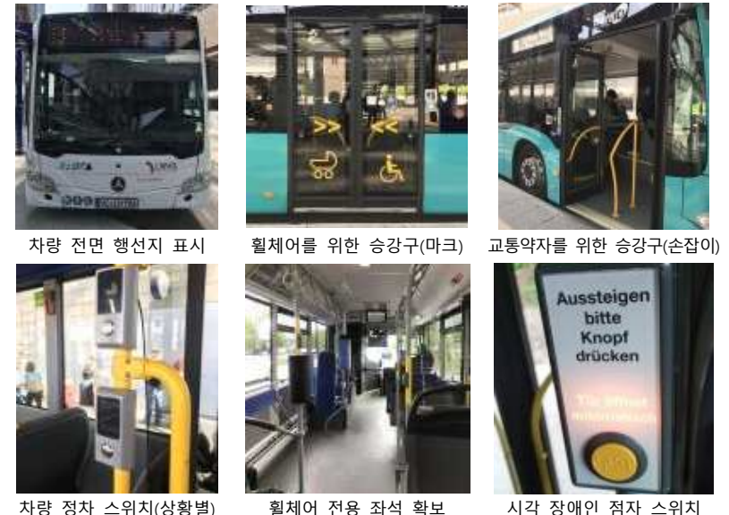
차량 전면 행선지 표시