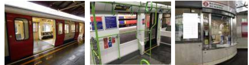
【 그림 1 】 영국 교통수단 접근성 및 안내 설비