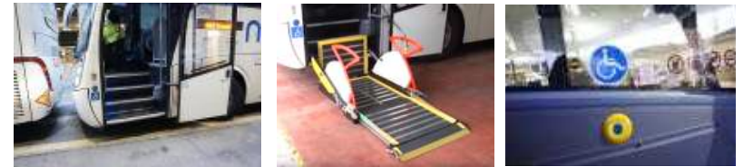
【 그림 6 】 National Express 장거리 버스 장애인 접근성(리프트)