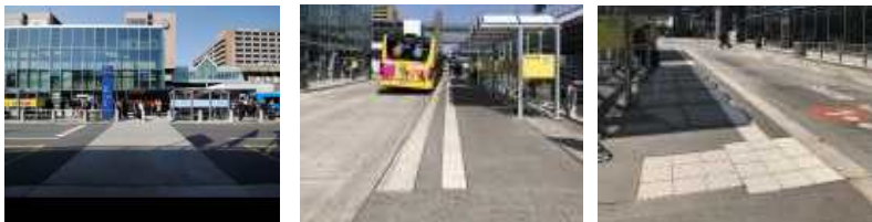
【 그림 25 】Frankfurt Airport 환승 버스 및 보도