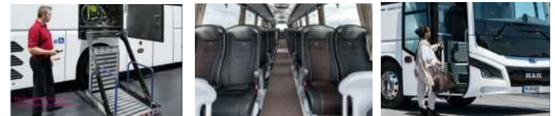
【 그림 24 】 MAN Lion's Coach