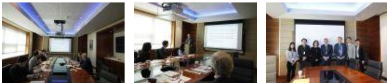
【 그림 2 】 Disabled Persons Transport Advisory Committee 기관 회의