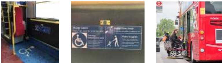
【 그림 5 】 런던 내 시내버스의 휠체어 전용 좌석 확보 및 안내 설비