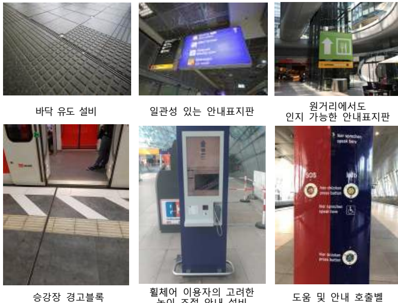
바닥 유도 설비