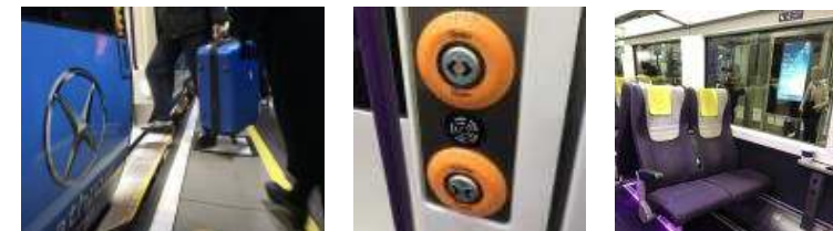
【 그림 7 】 Heathrow Express 차량 장애인 접근성 점검