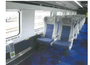
【 그림 3 】 휠체어 사용자의 사용 가능한 차내 설비가 포함된 열차 계획