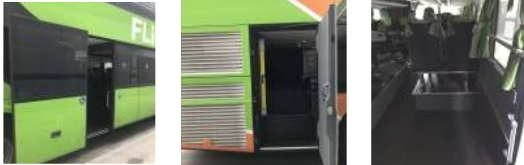
휠체어가 접근 가능한 출입구 승강구 접근설비(수동경사로) 휠체어 전용좌석 확보