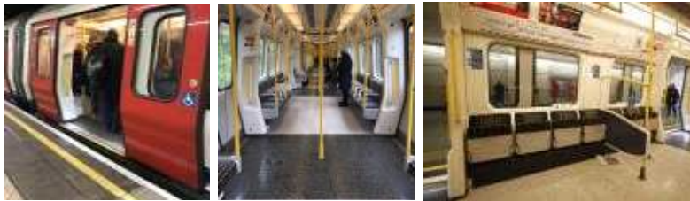
【 그림 8 】 휠체어 장애인을 위한 접근성 확보된 지하철 차량