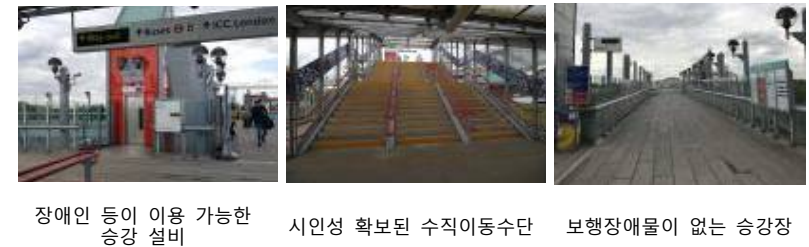
장애인 등이 이용 가능한 승강 설비 시인성 확보된 수직이동수단 보행장애물이 없는 승강장