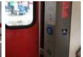
【 그림 19 】 Munich Main Hbf 철도 승강구