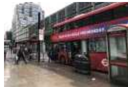
시설물과 연계된 버스 정차