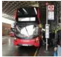
버스 승차장 안내설비