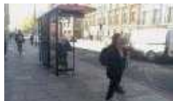
버스 정류장 구성(전면)