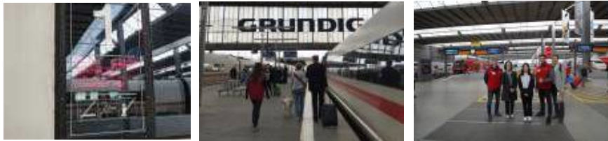
【 그림 22 】 Munich Main Hbf 철도 정보설비 및 안내서비스