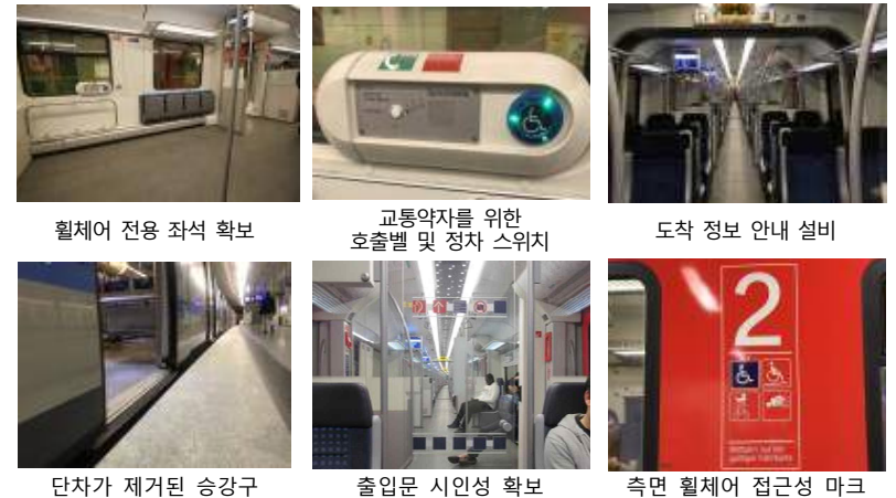
휠체어 전용 좌석 확보 교통약자를 위한 호출벨 및 정차 스위치 도착 정보 안내 설비