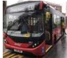
승강구와 승차장 간격 발생 최소화