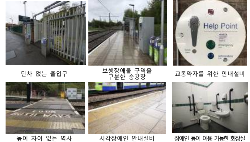
단차 없는 출입구 보행장애물 구역을 구분한 승강장 교통약자를 위한 안내설비 높이 차이 없는 역사 시각장애인 안내설비 장애인 등이 이용 가능한 화장실