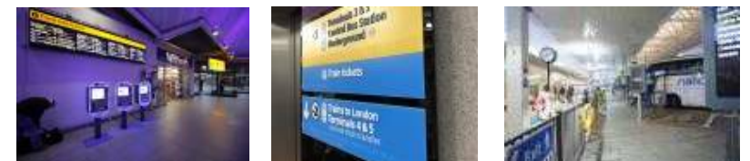
접근 가능한 매표소