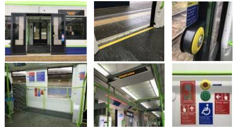
【 그림 10 】 TRAM LINK 차량 교통약자를 위한 설비