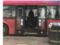
보행장애물 없는 승하차