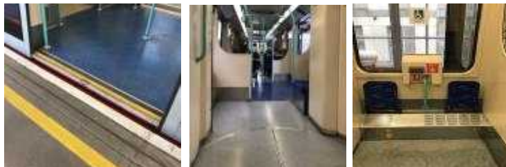
【 그림 9 】 휠체어 장애인을 위한 접근성 확보된 DLR 차량