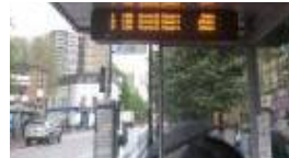
버스 도착 정보 안내판