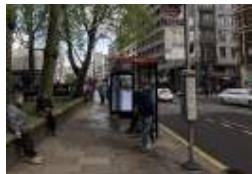
버스 정류장 구성(후면)