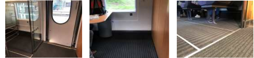
【 그림 26 】 Frankfurt Airport 행 ICE 열차 차내 설비