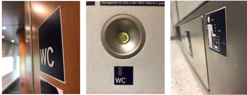
【 그림 27 】 Frankfurt Airport행 ICE열차 위생 설비