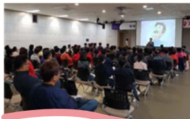
| 청렴특강 |