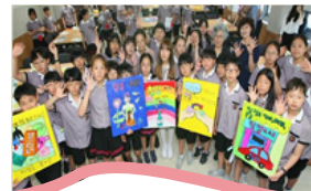
| 청렴체험교실 |